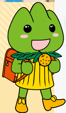
JA三重中央 マスコットキャラクター み～ちゅ